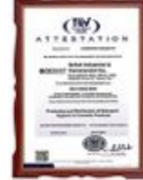
گواهینامه بین المللی رسیدگی به شکایت مشتریان ISO 10002 : 2014