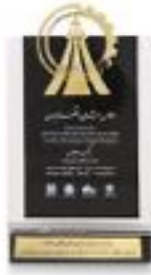
شانزدهمین اجلاس سرآمدان اقتصاد ایران تیرماه ۹۶