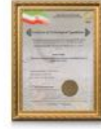
گواهینامه قابلیت‌های تکنولوژی