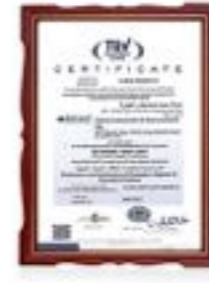
گواهینامه بین‌المللی سیستم بهداشت و ایمنی OHSAS 18001 : 2007