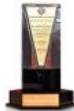
تندیس زنجیره موفقیت‌های سازمانی