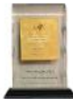
برگزیده اجلاس ناپک