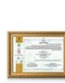
گواهینامه اهتمام به کیفیت مایع دستشویی