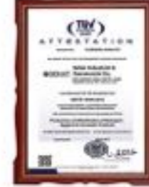
گواهینامه بین المللی سنجش رضایت مشتری ISO 10004 : 2012