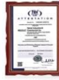
گواهینامه بین المللی رسیدگی اصول تولید ناب GMP