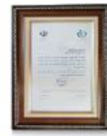
گواهینامه سلامت محور درجه الف از سازمان غذا و دارو