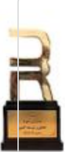
تندیس مدیران نمونه تحقیق و توسعه کشور