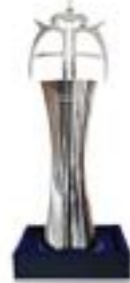
برترین نشان کسب و کار آسیا از انگلستان