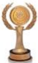
نشان ملی رعایت استانداردهای تولید محصولات شوینده ( اجلاس روسای آیتک)