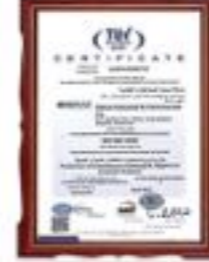
گواهینامه بین المللی سیستم مدیریت کیفیت ISO 9001 : 2008