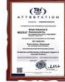
گواهینامه بین المللی ارزش برند ISO 10668 : 2010