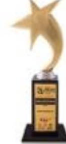
تندیس جهانی برند از سنگاپور