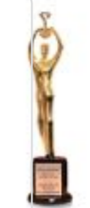
تندیس مدیران شایسته