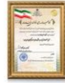
گواهینامه تایید توانمندی فناوریانه