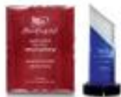
تندیس کارآفرین نمونه در جشنواره بین المللی کارآفرینی