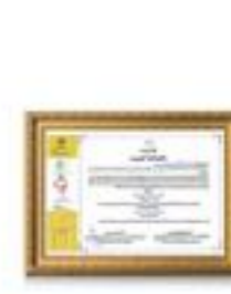
گواهینامه اهتمام به کیفیت انواع شامپو و مواد شوینده