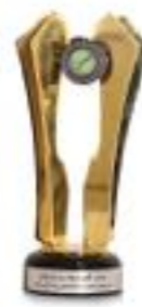
تندیس برند ملی، اقتدار ملی