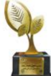
سومین همایش محیط زیست تیرماه ۹۶