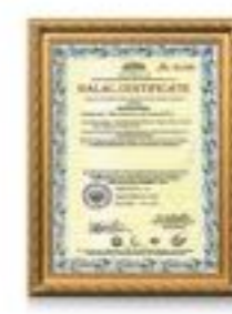
گواهینامه حلال برای تمام محصولات