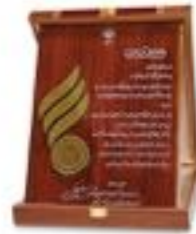
تندیس کنفرانس ملی کارآفرینی استقامت ملی و توسعه پایدار - آذر ۹۶