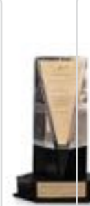
نشان مدیریت مدرن شایسته